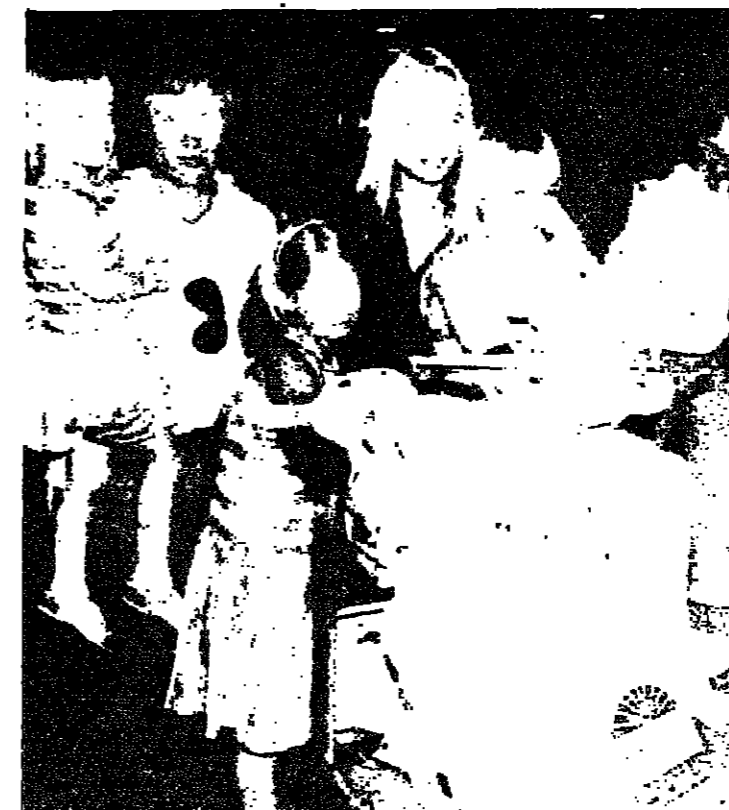
عائلة بريطانية هربت من الكويت الى السعودية لدى وصولها الى مطار ميرو في لندن

وقال صالح ان قرارات القمة لا تمثل حلا لمشكلة ان يراقب الزيارة الى الجزائر والمغرب والكويت، وانه لم يبق سوى مصر والكويت، وانه لم يبق سوى مصر والكويت.